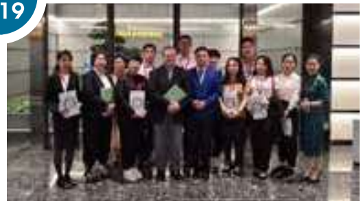
接待長城物業-應青藤學院及「南京金融城」和「重慶江北嘴金融城」兩個項目的代表團來港參觀考察。