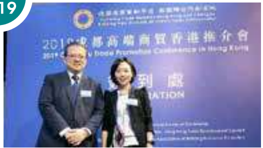
應成都市商務局和成都市樓宇經濟促進會的邀請出席成都市人民政府在香港舉辦的「2019成都高端商賈香港推介會」。