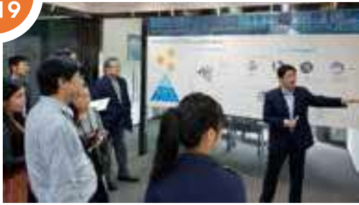
應邀參觀深圳樓宇設備設施智慧物聯網營運中心。