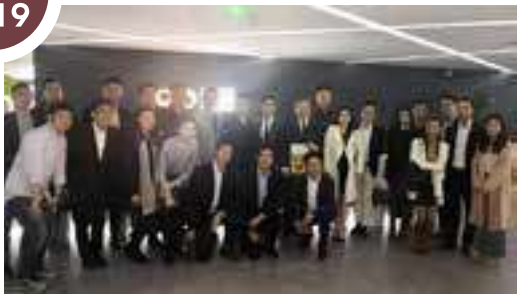
協助香港英會會員到深圳參觀商湯(Sensetime)，了解一下現時內地最新的智能科技及AI技術。