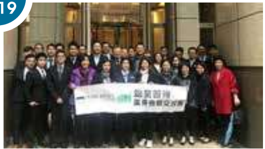
率領香港公開大學李嘉誠專業進修學院學生到深圳及廣州參觀考察學習。