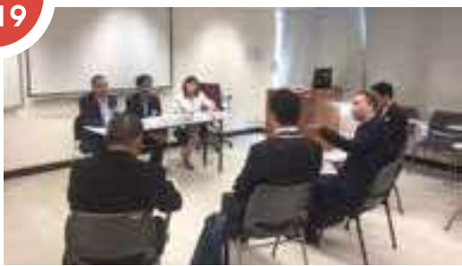
與香港地產行政師學會及香港和解中心聯合主辦的「物業管理周之優秀從業員選舉」收到逾300多份申請。