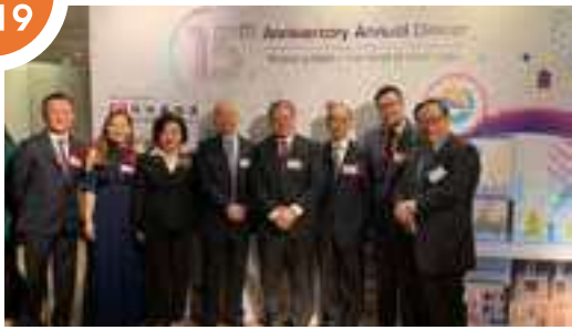
獲邀出席香港商場管理學會(ISCM)15周年晚宴。