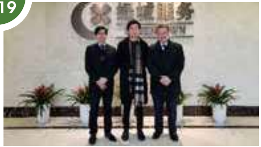
拜訪杭州市物業協會、綠城物業、富陽區物業協會，並與各單位洽談合作計劃。